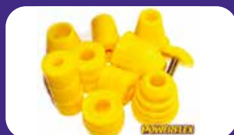
Fine corsa ammortizzatori