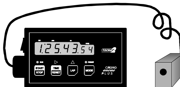
Cronometro e Rilevatore ottico FRX01

Tutti i tempi misurati sono anche memorizzati nello stesso PRO-TACK tramite il quale é possibile eseguire la stampa o la trasmissione degli stessi a Personal Computer.