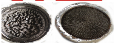
KAT OE DI SERIE